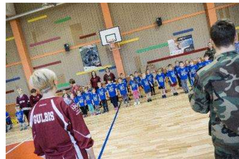
Vecpiebalgas pirmskolas izglītība iestāde «Mazputniņš»